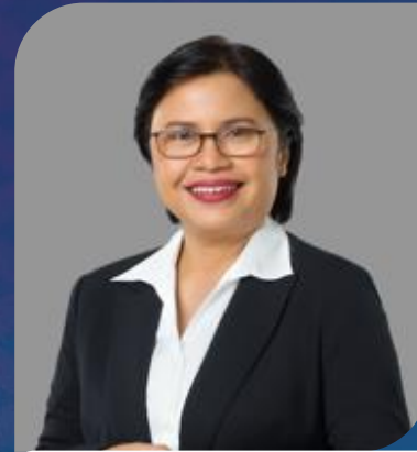
FM VENUSIANA R DIREKTUR CONSUMER SERVICE